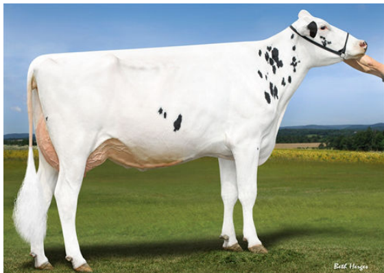
LADYS-MANOR GRNT OOHM DAM